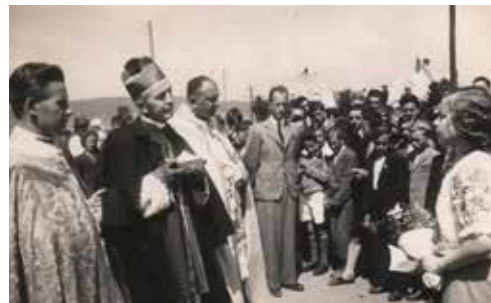
Slávnostná posviacka Kostola sv. Jána Bosca, 4. júna 1939

V súčasnosti prebieha proces jeho blahorečenia.