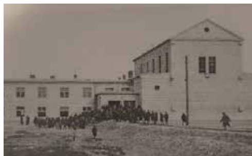
Novopostavený kostol v r. 1939

Prvý projekt kostola a saleziánskeho ústavu na Trnávke vznikol v polovici tridsiatych rokov. Vypracoval ho významný domáci architekt Gabriel Schreiber (1892–1953). Kostol mal byť trojlodový, postavený na spôsob baziliky, zároveň jednoduchý a účelný: