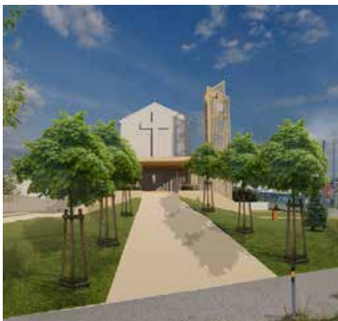
Plánovaná rekonštrukcia v r. 2023-2028

Nový rozsiahly projekt rekonštrukcie zohľadňuje požiadavky rozličných skupín veriacich: rodičov s malými deťmi, mladých, seniorov, modlitbových spoločenstiev aj hudobníkov. Počíta s úpravou interiéru, prebudovaním priestoru pred kostolom, s vybudovaním veže a bezbariérového prístupu.