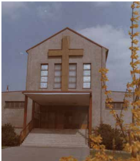
Kostol po dostavbe v r. 1970

predsieňou (babinec) a krytou terasou, ku ktorej vedie 12 schodov opatrených zábradlím. V predĺžení kostola bol v celej šírke hlavnej lode postavený masívny chór pre organ a zbor.