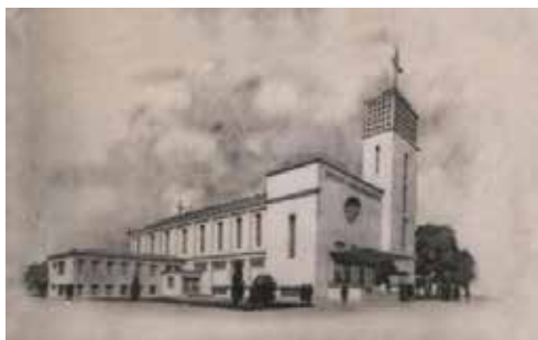
Pôvodný návrh kostola sv. Jána Bosca na Trnávke.

Dostavba (okrem veže, ktorá nebola povolená) sa realizovala podľa projektu vypracovaného Ing. arch. Gejom Schulteismom v rokoch 1968 až 1970. Kostol bol južným smerom predĺžený o poldruha modulu (9 m) a ukončený presklenou