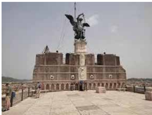
Socha archanjela Michala na Anjelskom hrade

„Nech nositeľ štandardy svätý Michal vedie duše do svätého svetla,“ píše sa v oficiu za mŕtvych. Preto kostoly s patrocíniom „svätého Michala“ často vznikali z cintorínskych kaplniek.