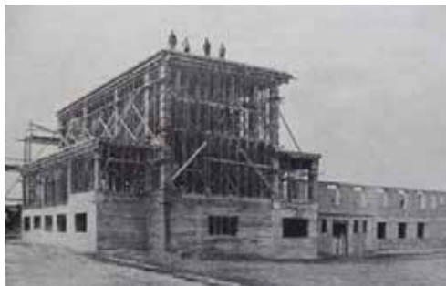
Stavba kostola na Trnávke