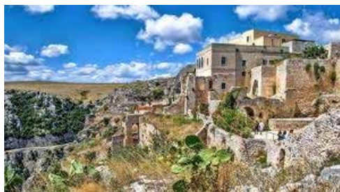
Gargano, Monte Sant'Angelo

Aj Anjelský hrad pri rímskom Tiberi vďačí za svoje meno archanjelovi Michalovi: Keď v roku 590 v Ríme zúrila morová epidémia, archanjel sa tu zjavil pápežovi Gregorovi Veľkému a oznámil mu koniec smrteľnej nákazy.