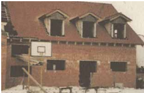
Ako to všetko začalo.

Futbalový klub SDM Domino a jeho poslanie, ktorým nie je len futbalový rozvoj, ale aj výchova mladých, sú nám všetkým dobre známe.