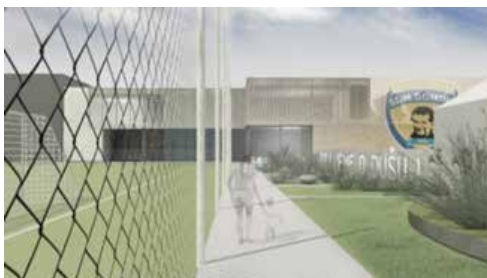
Aký je náš sen.

Príbeh SDM Domina od jeho počiatku však už všetkým tak známy nie je. Akou cestou si prešlo SDM Domino za 30 rokov od jeho vzniku?