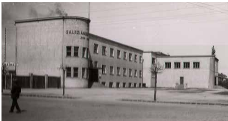
Miletička v čase spoločnej histórie

pozemok pre stavbu chrámu a areál oratória na Trnávke.