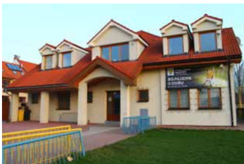
Ako to vyzerá dnes.