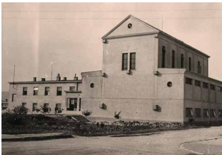
Trnávka v čase spoločnej histórie